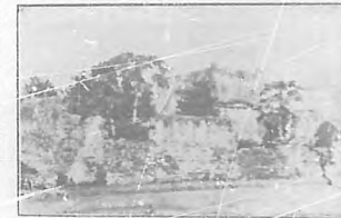
Bayamo.—Ruinas de la casa donde nació Francisco V. Aguilera.