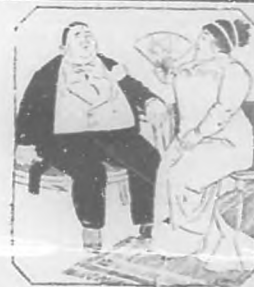
LA GORDURA ACORTA LA VIDA