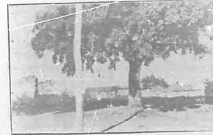
Bayamo.—Junto al árbol se levantaba la casa en que nació Saco.