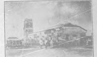
Bayamo.—Parroquia Mayor convertida en hospital de sangre después de la toma de la ciudad.

El pueblo manzanillero vá rápidamente acumulándose, sin distinción de ningún género, sobre la línea, en una extensión que abarca desde el arranque, junto al mar, hasta donde se ven las últimas casas del casco urbano. Blancos, negros y amarillos; mujeres y hombres; grandes y chicos; pobres y ricos; nacionales y extranjeros; liberales y conservadores. Allí no hay clases. Se vé un pueblo confundido y regocijado.