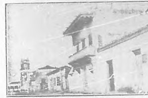
Bayamo.—Casa donde nació Carlos Manuel de Céspedes (era entonces de planta baja solememente.)

..... Hemos pasado la noche en una casa vacía (1) donde se han armado, expresamente, camas para el cuerpo de chicos de la prensa, los que, según unos, vamos en calidad de agre- gados á la comitiva, y, según otros, formamos parte inte- grante de la idem . En cuanto á mí, me dá lo mismo un concepto que otro. Agregado ó constituyente, mi propósito