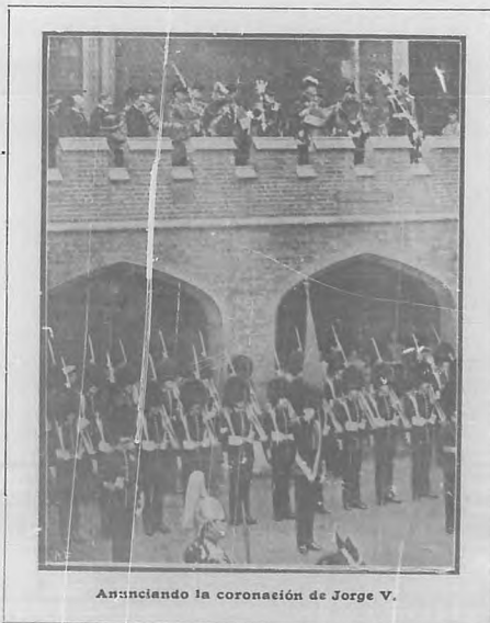
Avunciendo la coronación de Jorge V.

La ceremonia, como se vé, es propia de otras edades, de otros tiempos en que no hubiera «Gaceta Oficial».