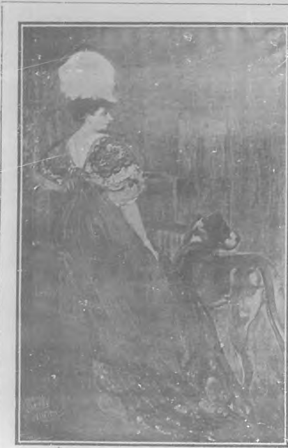
Retrato por Martín Fernández de la Torre.