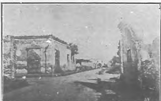
Ruinas del Salvador y esquina de San José.