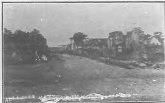
Bayamo.—Ruinas de la calle del Salvador, frente á San Francisco.

N. de la R.—El estimado compañero Sr. Alcover nos ha ofrecido ir dándonos, para su publicación en BOHEMIA, las impresiones que recogió y escribió durante el viaje Presidencial, en el que fué representando á "El Triunfo." Los apuntes anotados por Alcover, como se ve por el artículo que hoy publicamos, refiérense exclusivamente á la impresión que cada ciudad visitada le produjo, sin detenerse mucho en la crónica de los actos que se sucedieron y que fueron objeto de las informaciones del momento.