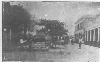
Bayamo.—Casa del Ayuntamiento