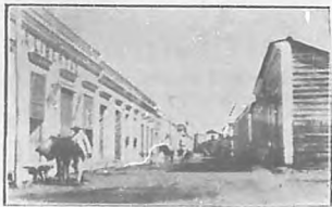
Bayamo.—Su calle principal, antes llamada del Angel, hoy General García.

Escojo el primer medio de transporte; pero lo escojo y tomo por asalto al mismo tiempo que lo pienso, valiéndome de mi ligereza y astucia. ¡Oh! y que no desplegara semejantes facultades..... Entre la clase "comitival" van fieras que sólo piensan entomar para sí lo mejor; ésto sin contar con algún aventurero de cartel obligado, que figura en todos los sermones, como san Agustín. De no haber sido ligero, era de cajón el viaje en