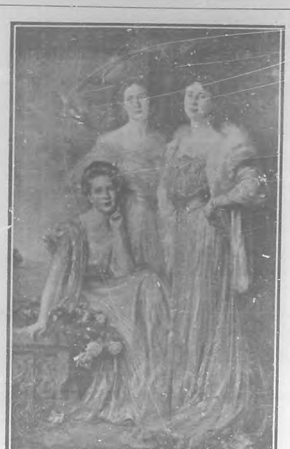
Retrato por Gaspar Ritter.