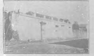
Bayamo.—Casa en que nació don Tomás Estrada Palma.

Al fin, tanto tiempo transcurrió, que ya se ha hecho en uno situado frente al Parque, y nos desayunamos finalmente. Soy, pues, de los primeros que llegan al punto de la ciudad manzanillera, desde donde arranca la nueva y suspirada vía férrea que vá á inaugurarse oficialmente dentro de breves momentos. Son las 7 y media de la mañana del día 12 de Marzo de 1910. No veo estación alguna. Una caseta de